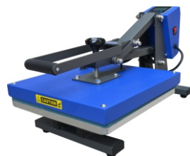
Prensa Plana Manual