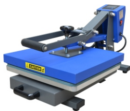
Prensa Plana Automática